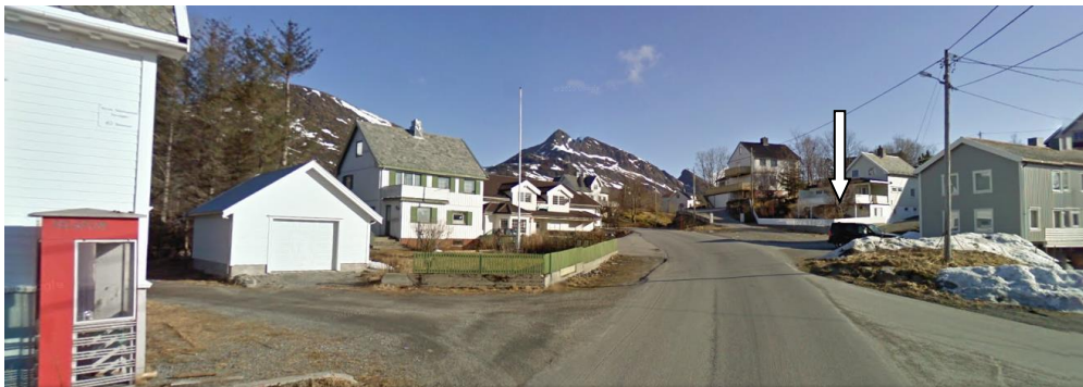
Bilde fra Google Maps Street view.

Der Pilen er på bildet, har det tidligere stått et buskur som ble tatt av været.