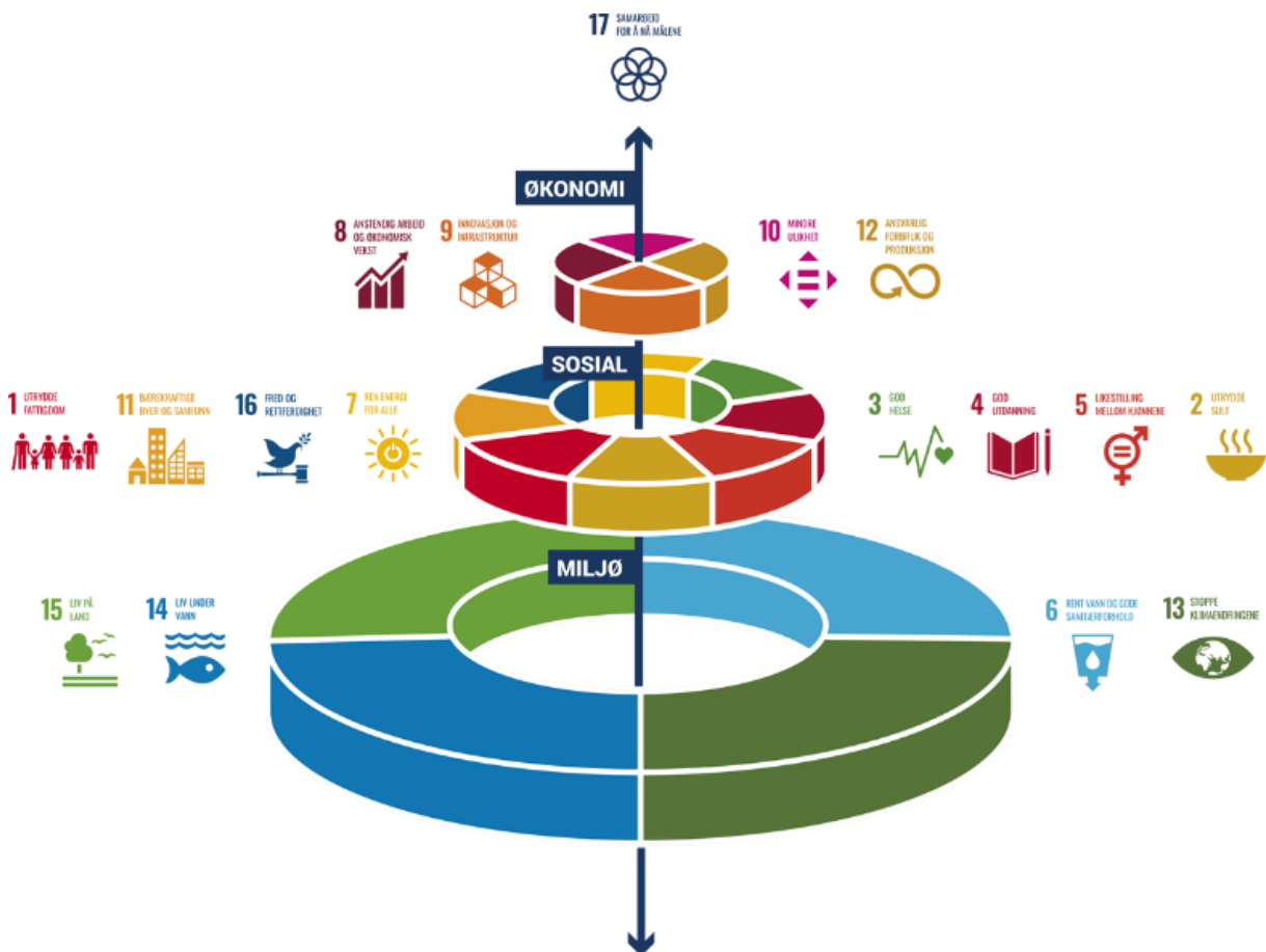
FNS tre bærekraftsdimensjoner og tilhørende bærekraftsmål

Regjeringen forventer at alle kommuner legger FNs bærekraftsmål til grunn for sin planlegging. De 17 målene kan systematiseres i følgende modell, som viser hvilke mål som omhandler de tre dimensjonene økonomi, sosial og miljø. Bærekraftbegrepet handler om at vi skal tenke på de tre dimensjonene samtidig. De valgene vi gjør skal stå seg både når vi teker på sosiale konsekvenser, økonomiske konsekvenser, og miljømessige konsekvenser.