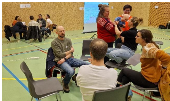
Åpent møte om ny kommuneplan 30. januar 2023.

Kommunestyret har selv hatt to seminar underveis for å drøfte utfordringer og muligheter, drøfte innspill som er kommet og peke ut innsatsområder. Og formannskapet har hatt flere behandlinger av planen underveis. Planen har vokst fram gjennom innspill fra veldig mange. Enkeltpersoner, frivillige lag og organisasjoner, andre offentlige organisasjoner, næringslivet og ledergruppen i kommunen har vært viktige. Ca 50 personer deltok på Åpent møte den 30. januar på Sørpågen skole.